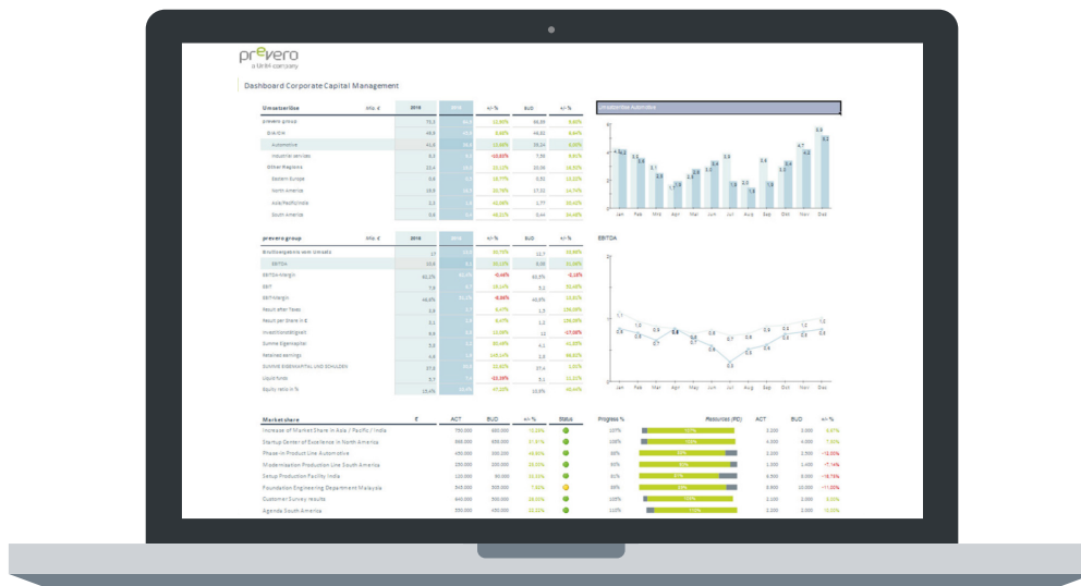
Abb. 3: KPI-Dashboard